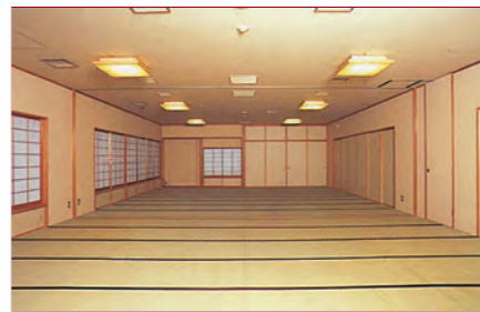
合宿所の和室(大広間)