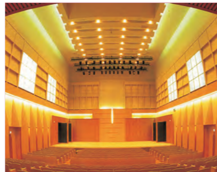
音楽ホール(座席数420)